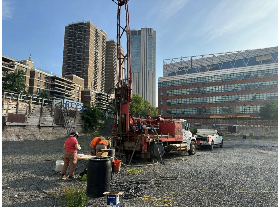
Photo 2 – Photo facing northeast of ADT performing drilling activities at AB-2.

Photo 1 – Photo facing north of ADT setting up at AB-2 prior drilling operations.