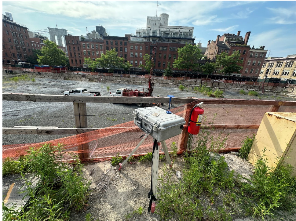
Photo 6 – Photo facing north-northeast of the Beekman Street CAMP station.