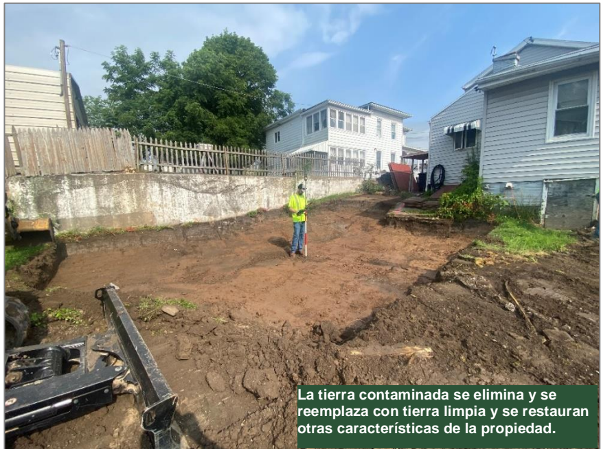
La tierra contaminada se elimina y se reemplaza con tierra limpia y se restauran otras características de la propiedad.

El proyecto se está financiando y ejecutando según el programa Superfondo Estatal (State Superfund program). Los documentos relacionados con la limpieza de este sitio se pueden encontrar en las ubicaciones identificadas abajo en "Para Más Información." Los detalles adicionales del sitio, como resúmenes de evaluación ambiental y de salud, están disponibles en el sitio web del DEC, en: https://www.dec.ny.gov/chemical/107812.html .