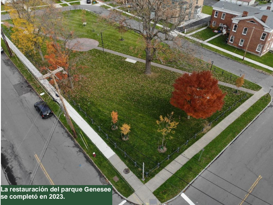
La restauración del parque Genesee se completó en 2023.

Desde 2017, DEC y DOH y sus contratistas han completado la limpieza de 212 propiedades. La investigación inicial determinó que 23 propiedades no requerían remediación. Al día de hoy, un total de 235 propiedades en el área de remediación se han completado y han sido identificadas en condición de "No Adicional Acción" ("No Further Action").